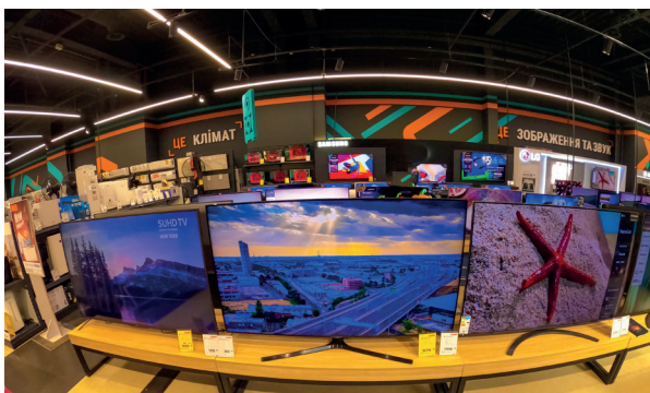
När det ekonomiska läget blir osäkert avstår konsumenter från sällanköpsvaror som till exempel kläder, möbler, inredning och hemelektronik.

När det ekonomiska läget försämras och arbetslösheten börjar stiga i vissa branscher ökar osäkerheten i hela ekonomin. De som har jobb kan se risken för arbetslöshet öka och företag kan känna av att det blir svårare att sälja sina varor och tjänster. Den ökade osäkerheten gör att hushållens och företagens beteenden förändras. Hushållen minskar konsumtionen och ökar sparandet för att klara av kortare perioder av arbetslöshet. De kan även förändra sitt konsumtionsmönster genom att avstå från sällanköpsvaror och i synnerhet varor som är förknippade med ökade fasta kostnader. Det minskar efterfrågan och aktiviteten i hela ekonomin.