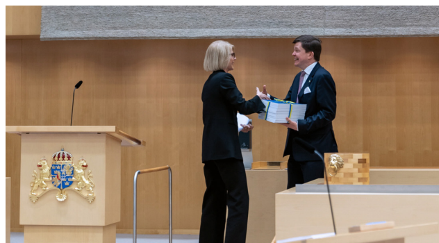
Finansministern är det statsråd som överlämnar budgetpropositionen till riksdagens talman.

Euroländerna har till skillnad mot Sverige ett underskottstak. För dessa länder gäller att underskottet ska vara högst -3 procent av BNP. Egentligen är det inte konstigt att acceptera ett visst underskott eftersom ekonomisk tillväxt gör att skulden som andel av BNP faller. Men det blir ett problem om räntan på skulden långsiktigt skulle överstiga tillväxttakten i ekonomin.