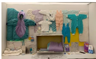
En moderskapsförpackning i utställningen på Finlands nationalmuseum.

Ett fantastiskt exempel på en finländsk framgångssaga, och kanske något av ett kuriöst inslag i denna rapport, är den finska moderskapsförpackningen som sedan första halvan av 1900-talet delats ut till alla nyblivna mödrar i Finland. 2