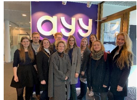
Saco studentråd tillsammans med ledningen för AYY – Aaltos studentkår.

En nackdel är dock att det är väldigt svårt att studera deltid vilket urholkar det finska högskolesystemet. Studietid och examensdatum är inte lika fyrkantigt som i Sverige utan många väljer att arbeta och självmant studera deltid inofficiellt.