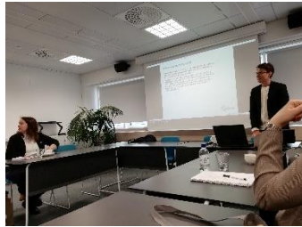
Mika på Akava går igenom visioner för EU-samarbete.

Under mötet fick vi reda på att Finlands motsvarighet till YH-utbildningar är poänggivande på ungefär samma sätt som högskoleutbildningar, vilket är intressant både ur en svensk kontext, såväl som för Saco och Saco studentråd som till skillnad från Akava inte organiserar de som har examen från YH, utan enbart från högskola.