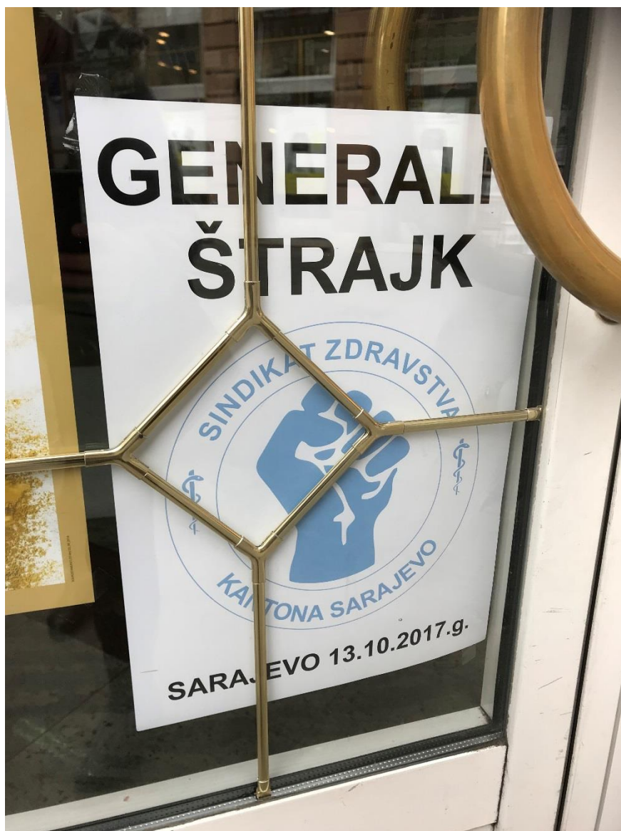
Poster om apotekspersonalens strejk i Sarajevo.