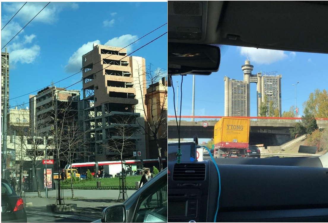
Bombade hus som minnesmärke från kriget.

Vi landade i Belgrad som är Serbiens huvudstad, med cirka 1,2 miljoner invånare. Taxichauffören som körde oss till hotellet visade sig tala flytande engelska och frågade om vi ville att han skulle berätta lite om Belgrad. Hela resan från flygplatsen till hotellet pratade han oavbrutet och berättade om läget i Belgrad och landet. På väg in i staden åkte vi förbi en byggnad som han berättade symboliserar de två delar som Belgrad består av; den gamla och den nya, samt de broar som går mellan delarna. Han berättade att utländska företag köper upp inhemska företag och kör dem i botten. Vidare att folket väljer premiärminister som i sin tur utser president. Mannen som nu är president valde en premiärminister som gör allt han vill att hon ska göra. Chauffören berättade att den han ser som den bästa tänkbara ledaren är Putin, då han är en person som står upp för sitt land. Chauffören berättade att delar av befolkningen fortfarande var upprörda över Natos attack mot landet under Balkankriget. Han pekade ut två bombade byggnader som inte återställts utan som är tänkta som ett minne av det som Nato utsatte dem för.