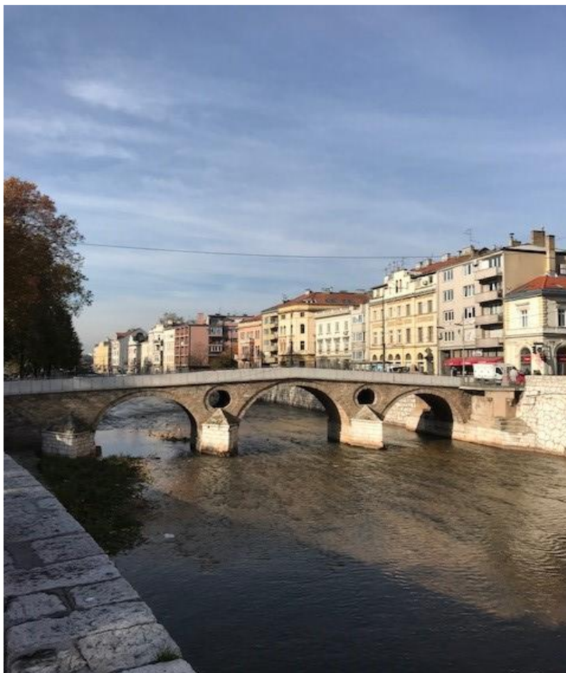
Latinska bron där Franz Ferdinand blev skjuten.

Genom den organisation man har på samhällets strukturer och instanser, men många olika nivåer, så måste fackliga finnas på många olika platser, vilket blir tidskrävande i och med att så många lagändringar genomförs. Detta tar tid från att utbilda förtroendevalda. Att man genomför många lagändringar och inför nya krav är dubbelt. Man vill visa att man närmar sig EU genom de lagar man förändrar, men då man inte fullföljer dessa lagar i praktiken, minskas inte glappet till facket som det borde. Det är svårt att förklara detta, då det är ologiskt, till och med för dem som lever mitt i det.