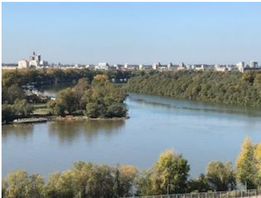
Vy över floderna Donau och Sava i Belgrad.

Vi fick många frågor om hur välfärdssystemet och socialtjänsten fungerar i Sverige. Och mycket av tiden gick åt till att svara på frågor och informera om hur det ser ut här hemma. Vi berättade även om Akademikerförbundet SSR och vilka frågor som förbundet driver och har drivit de senaste åren. Det blev tydligt att vi i Serbien och Sverige strävar efter samma mål, både gällande välfärden och fackets ställning och möjlighet att påverka. Dock är det stora skillnader gällande hur långt man har kommit i detta arbete i våra respektive länder.