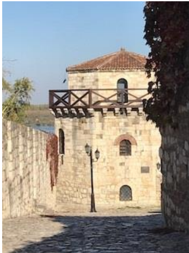
Kalemegdan, ett fort i centrala Belgrad.

En annan stor utmaning för förbundet är finansiering av det fackliga arbetet. Förbundet hyr huset där de har sitt kontor och det betalas av medlemmarna. Medlemsavgiften är en procent av nettolönen. Av dessa pengar går 21 % till centralt arbete, 44 % till förbundet och 35 % till de förtroendevalda. Eftersom lärare har extra svårt att utföra fackligt arbete på arbetstid så får de upp till 12 % mer i lön för att göra detta utanför arbetstid. De första tio åren efter att förbundet bildats, kunde man erbjuda alla gratis telefonrådgivning, för att locka medlemmar. Men detta har man inte möjlighet till idag, dels utifrån ekonomi och dels utifrån personal, så nu ger man endast rådgivning till medlemmar.